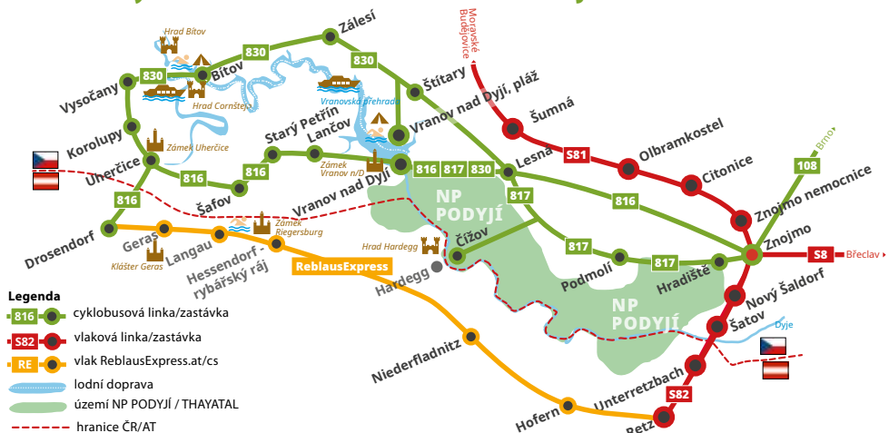
Schéma cyklobusů a vlaků IDS JMK na Znojmsku

Jízdenky IDS JMK platí také ve vlacích včetně jízdy do Retzu (linka S82), neplatí na lodní dopravě po Vranovské přehradě a v ReblausExpressu.